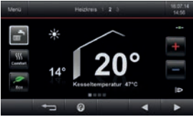
Renkli dokunmatik ekranlı Vitotronic 200 kontrol paneli

Vitodens 200-W, paslanmaz çelik Inox-Radial ısıtma yüzeyi, MatriX-silindirik brülörü ve renkli dokunmatik ekranı sayesinde yüksek verimli, uzun ömürlü ve konforlu bir işletme sunmaktadır.