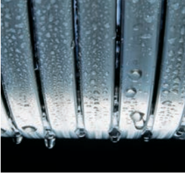
Inox-Radial ısıtma yüzeyi – uzun ömürlü ve yüksek verimli