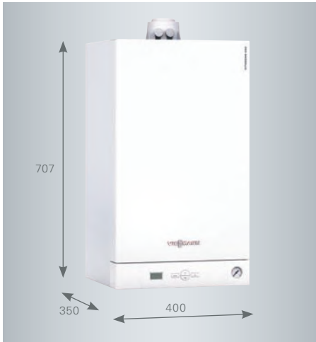
Vitodens 050-W kompakt boyutları ve düşük ses seviyesi sayesinde oturma hacimlerine kolaylıkla entegre edilebilir.